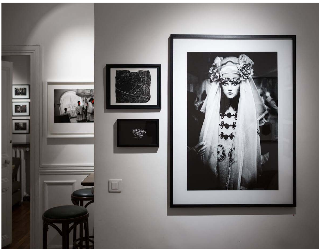
accrochage de l'exposition WALLS 01